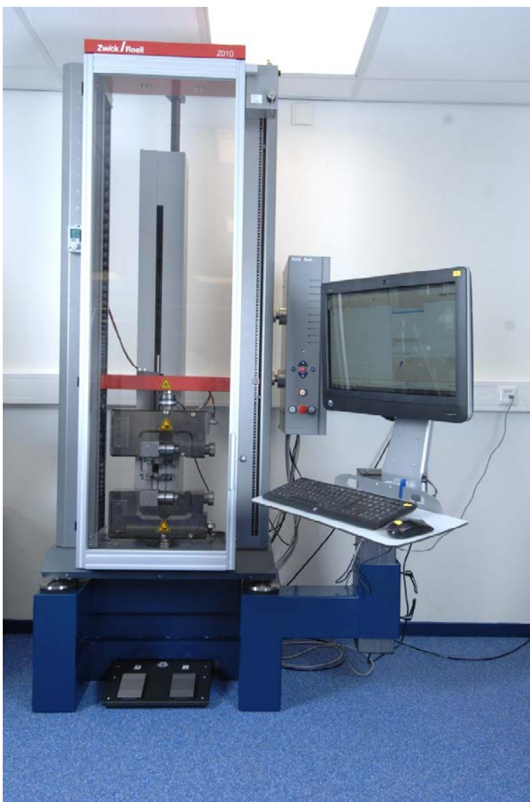
Foto: Trekbank (o.a. apparatuur voor bepalen afpelsterkte lasverbindingen).