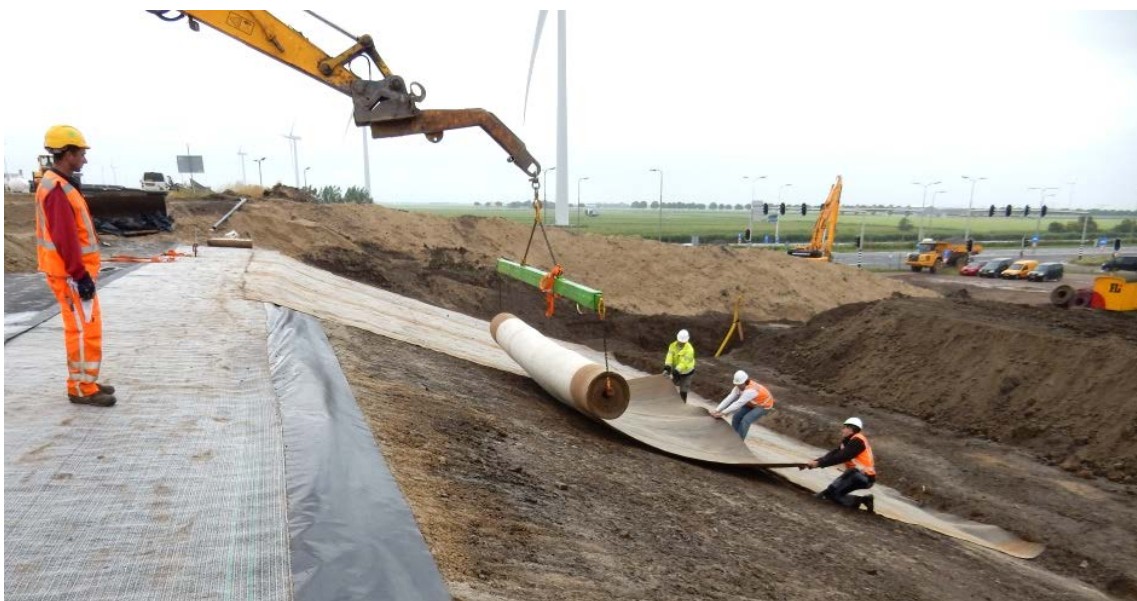
Foto: Toepassing bentonietmat.

Om beschadigingen aan de voorziening te voorkomen, hebben niet-destructieve onderzoeks- en meetmethoden de voorkeur. Meetmethoden die niet in dit protocol zijn voorgeschreven, zijn toegestaan wanneer de inspecteur zich ervan heeft overtuigd dat hij hiermee een betrouwbare kwalificatie van de voorziening kan verkrijgen.