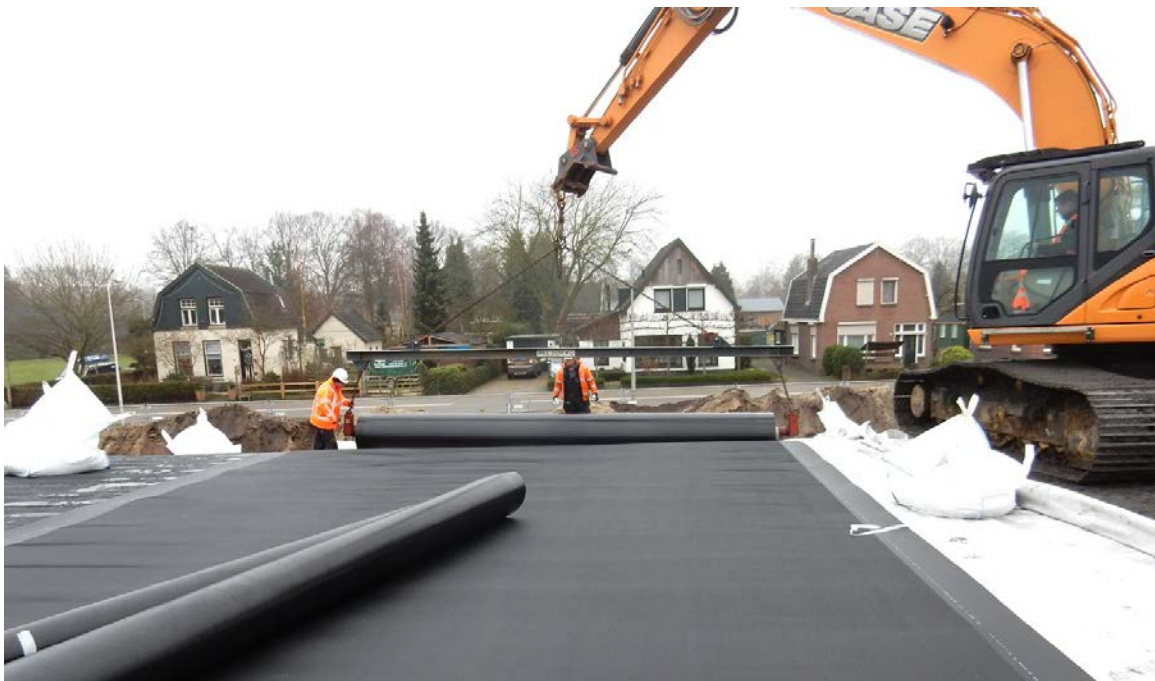
Foto: Aanbrengen HDPE-folie.