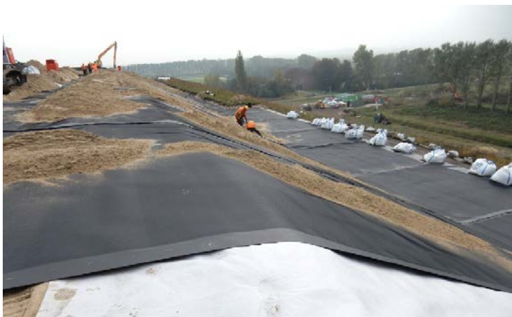
Foto: Aanbrengen geotextiel en HDPE-folie.