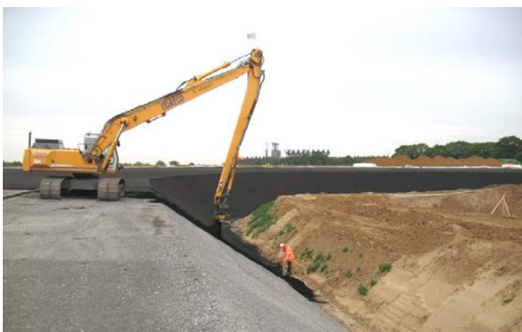
Foto: Aanleg van zandbentonietpolymeergel.