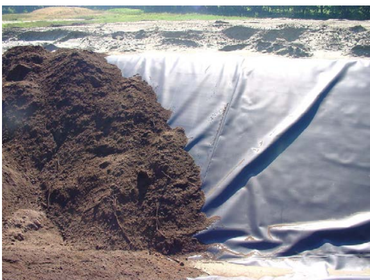
Folie: Belasten wanneer het niet strak ligt (o.a. uitzetting in de zon).