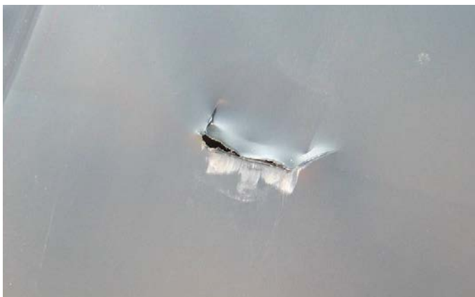
Foto: Beschadiging folie.