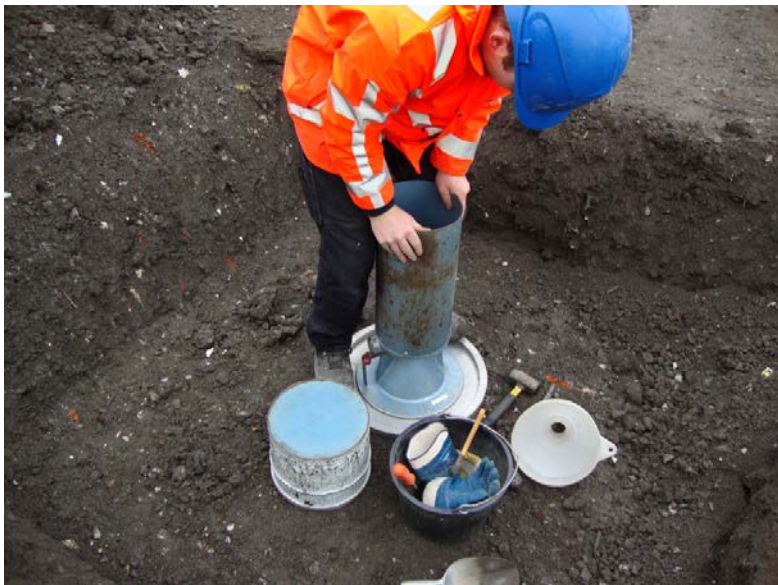
Foto: Bij 4.2 en 4.3: Meting verdichting AEC bodemas en bepalen verdichtingsgraad.