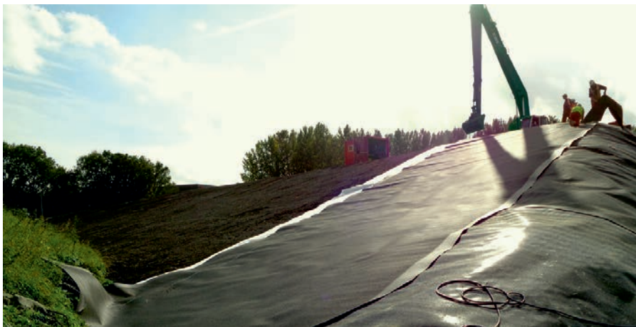
Foto: Overzicht aanleg IBC-werk.