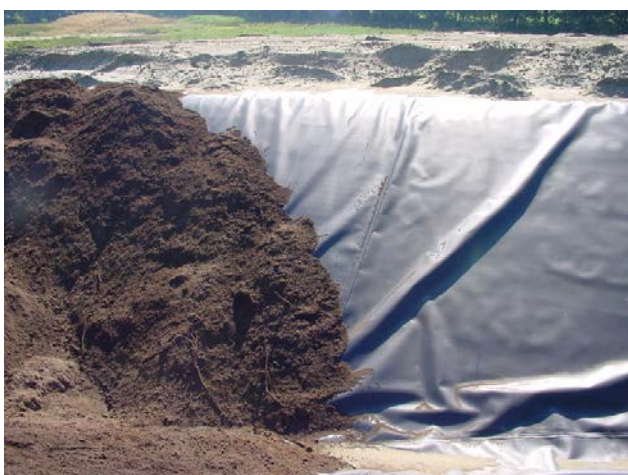
Foto: Folie belasten wanneer het niet strak ligt (o.a. uitzetting in de zon).